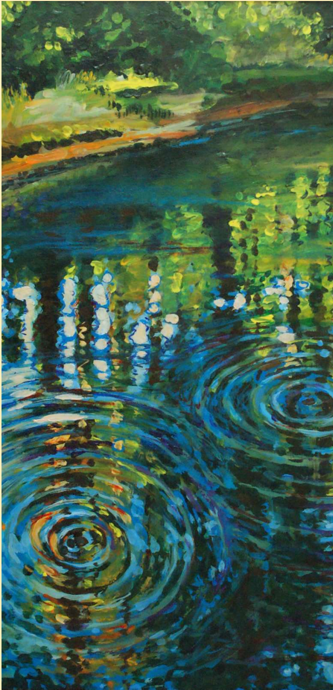
© alle Bilder Malerei Michael Bock