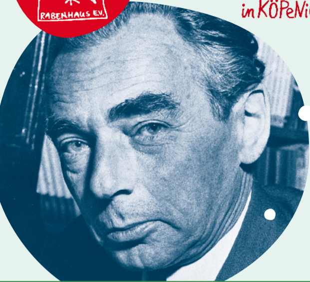
Köpenicker Salon, Gesundheitsforum und Anderes